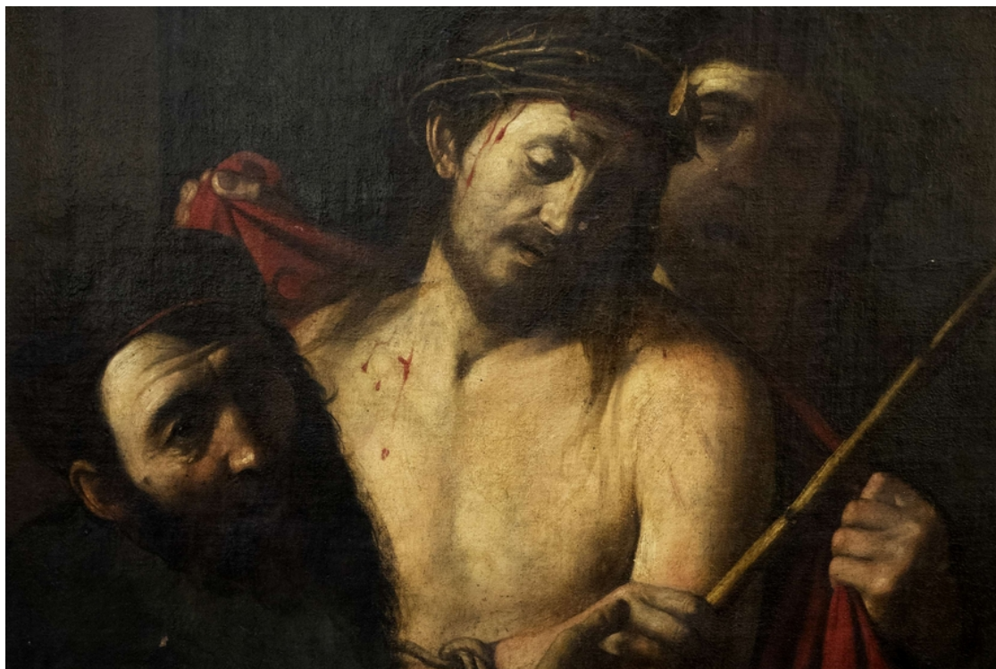
(CARAVAGGIO, Hecce Homo - 1605)